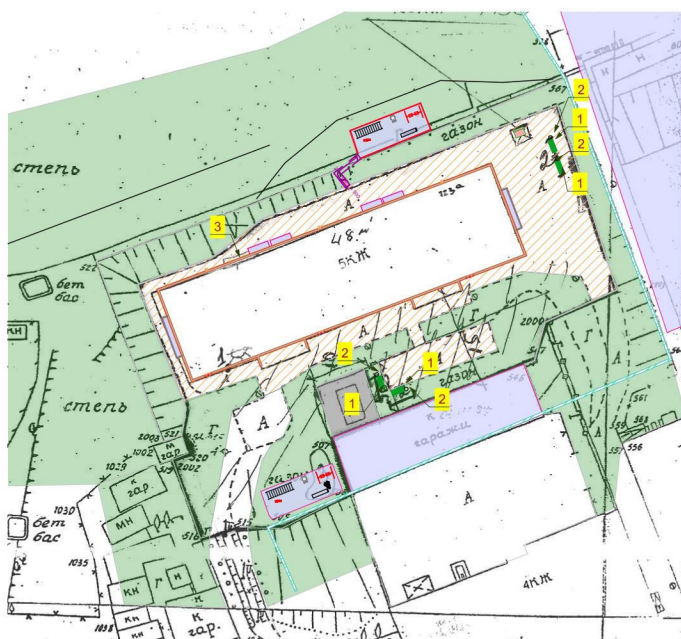
Схема благоустройства. М 1:500.